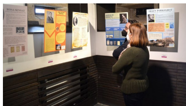
A Vicerreitoría acolle unha mostra que rememra as traxectorias de 32 docentes e colectivos.