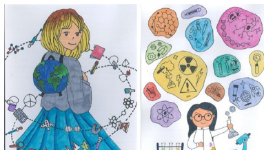
Obras gañadoras na modalidade visual

Emoción por descubrir e fascinación por un traballo que consideran apaixonante. Científicas e tecnólogas da Universidade de Vigo uníronse este xoves á celebración do Día Internacional da Muller e a Nena na Ciencia organizando diferentes actividades coas que dar a coñecer entre as alumnas de ensino secundario as súas profesións. A pandemia non permitiu este ano a presencialidade, pero o espírito da xornada mantívose coa organización de diferentes encontros. +info .