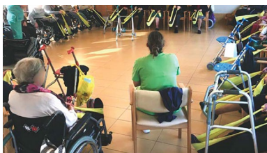
A investigación desenvolveuse en tres centros xeriatricos