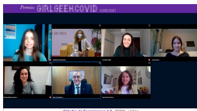
Foto de familia das premiadas co reitor, a presidenta da Deputación e a directora da Unidade de Igualdade da UVigo