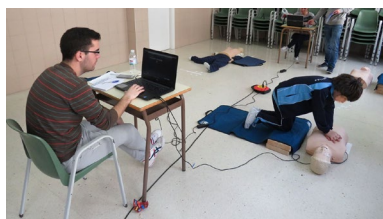
Un intre das medicións realizadas, antes da pandemia, nun centro educativo