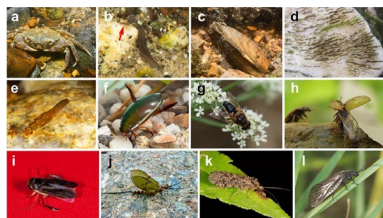
A base de datos reúne información de 280 grupos de especies e xéneros.

As paradas cardíacas sufridas fóra dunha contorna hospitalaria constitúen a terceira causa de morte nos países industrializados, tralo cancro e as enfermidades cardiovasculares, e ante este tipo de episodios resulta vital a realización das manobras de reanimación cardiopulmonar (RCP) por parte das persoas que se atopan no lugar, ata a chegada dos servizos sanitarios. +info.