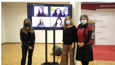
Foto de familia de Cereijo, Silva e Pérez, xunto coas premiadas, que participaron por videoconferencia.

Promover o uso do galego como lingua de socialización entre a comunidade universitaria é o obxectivo de Falamos , un programa impulsado pola Concellaría de Normalización Lingüística do Concello de Pontevedra e a Área de Normalización Lingüística da Universidade de Vigo, que propón ao alumnado novas actividades para os próximos meses, como un ciclo de conversas virtuais sobre diferentes temáticas e encontros na rede social Instagram. +info.