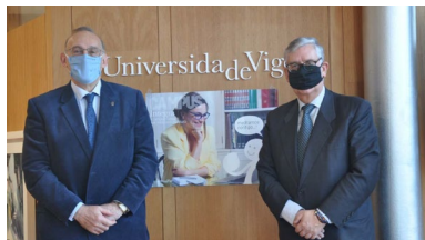
O novo presidente da CEG reuniuse hoxe co reitor da UVigo