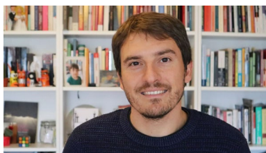
Gañador dunha Starting Grant do ERC, Pansera formará o seu propio grupo de investigación no campus de Pontevedra.