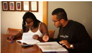
A medida compensatoria podería facerse efectiva en 66 materias

Hai un ano, a Universidade de Vigo e a Deputación de Pontevedra asinaban un compromiso mutuo para poñer en marcha a Cátedra de Feminismos 4.0 Depo-UVigo, co dobre obxectivo de evitar que no espazo dixital se reproduza e amplifique a desigualdade de xénero que persiste na sociedade e, ao tempo, incrementar a presenza feminina nas áreas científico-tecnolóxicas. +info.