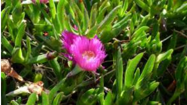
A tese de Yaiza Lechuga analiza o avance do Carpobrotus edulis nos complexos dunares galegos.