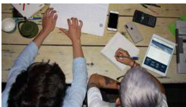
A convocatoria sairá en setembro e resolverase con posterioridade á do Ministerio