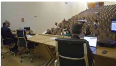
A EE Industrial apostará pola presencialidade 100% en todos os seus graos e mestrados

O pasado mes de abril o Consello de goberno da UVigo aprobou unha medida co obxectivo de poder introducir unha compensación nas notas do alumnado, caso de detectarse unha diminución significativa nos resultados académicos correspondentes ao período de vixencia do estado de alarma, respecto dos cursos anteriores, e que ese descenso nas cualificacións puidese considerarse atribuíble ao paso da docencia presencial á virtual. +info.