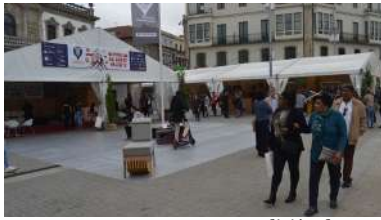
Edición de 2019