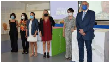
O obxectivo é activar "unha mirada crítica" con perspectiva de xénero dende os estantes destes espazos

Xa pode descargarse para calquera dispositivo móbil Android talkAAActive, unha aplicación gratuíta dirixida a facilitarlle ás persoas con autismo a súa comunicación na contorna laboral. A nova app foi deseñada polo Grupo de Tecnoloxías da Información do centro de investigación atlanTTic da Universidade de Vigo, grazas ao financiamento achegado por Indra, unha das principais empresas globais de tecnoloxía e consultaría, e a Fundación Universia, entidade que impulsa a accesibilidade e a inclusión das persoas con discapacidade na sociedade. +info .