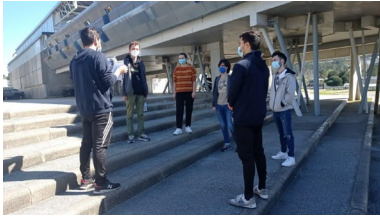
Participantes nunha das actividades celebradas no campus de Vigo o pasado mes de abril