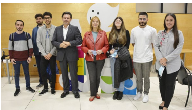
Foto de familia de autoridades e alumnado