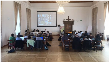
A Czech University of Life Sciences acolle a primeira reunión do proxecto.