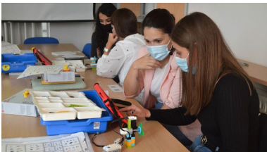
Dirixido a docentes da facultade e centrado nos kits de robótica educativa de Lego

A Cátedra Telefónica Espazos de Innovación lanza unha convocatoria de premios destinados a poñer en valor os mellores traballos fin de mestrado relacionados co desenvolvemento sostible. En total outorgaranse cinco galardóns cunha contía de 500€ cada un a estudantes da Universidade de Vigo que presentasen o seu TFM ao longo do curso 2020/2021 na Universidade de Vigo cunha cualificación igual ou superior a 7 puntos. +info .