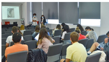
Ciencias da Educación e do Deporte acolleu o inicio dun ciclo de conferencias centrado nos ODS