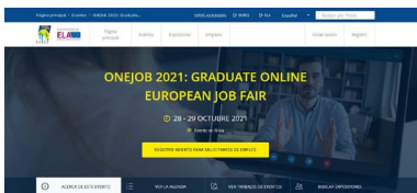
Más información sobre este evento A feira desenvolverase ao longo deste xoves e venres

A aposta da Universidade de Vigo pola ciencia en aberto plásmase no Plan Estratéxico 2021-2026 e concrétase nunha Política institucional de acceso aberto á produción científica . Pero para visibilizar este posicionamento, a institución tamén se une á celebración da Semana Internacional do Acceso Aberto, que se está a celebrar do 25 ao 31 deste mes, baixo o lema Importa como abrimos o coñecemento: construíndo equidade estrutural . +info .