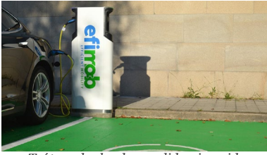
Trátase dunha das medidas inseridas no plan de acción do Green Campus