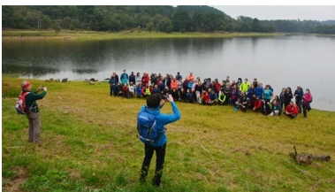
Foto de familia da andaina