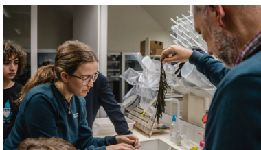
Un intre da viaxe en barco pola ría dunha edición previa de Divulgando Ciencia Singular

Abrir os laboratorios á cidadanía e achegar a investigación científica e tecnolóxica á sociedade. Con estes obxectivos naceu en 2018 o programa Divulgando Ciencia Singular , unha iniciativa para que os seus centros de investigación da Universidade de Vigo dean a coñecer de primeira man o traballo que desenvolven. +info .