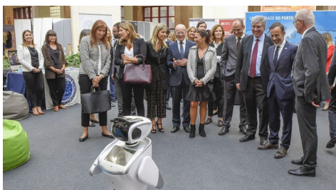
As autoridades no posto da UVigo na feira. Egidio Santos/ U. Porto.