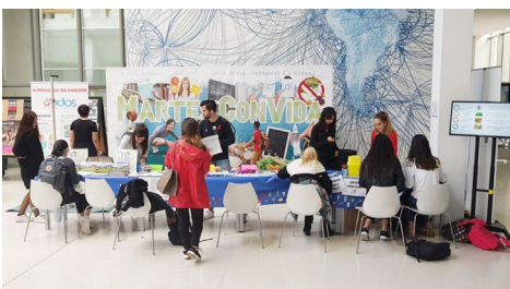
A sexualidade, protagonista da nova xeira dos Martes Saudables.