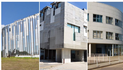
Exeria, Ernestina Otero e Filomena Dato darán nome aos edificios administrativos do campus.