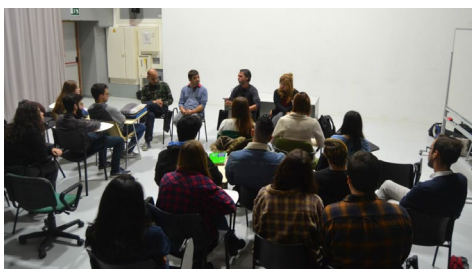
Representantes de Amencer-Aspace e Fundación Juan XXIII mantiveron un coloquio co alumnado.

150 entidades, entre empresas, asociacións profesionais e organismos públicos, participan entre onte martes e hoxe na Finde.U, Feira Internacional de Emprego Universitario, que se está a celebrar en Porto. A esta edición portuguesa sucederá a vindeira semana próxima a de Vigo, os días 23 e 24, no Ifevi. + Info.