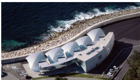
O percorrido en barco partirá do peirao da Laxe ata chegar á Ecimat, en Toralla.