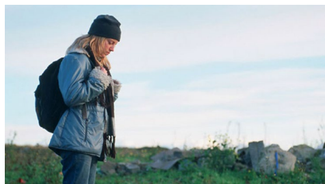
Imaxe de A vida segrega das palabras, unha das películas que se proxectará.

A Facultade de Dereito do campus de Ourense acollerá do 11 de outubro ao 20 de novembro unha nova edición do ciclo Pensar o Cine. A cita celebra este ano a súa décima edición e faino abordando un tema de debate na actualidade no eido social e xurídico como é o da violencia sexual. Serán oito as proxeccións e oito as conferencias doutros tantos expertos e expertas que abordarán cuestións relacionadas con esta violencia, desde a construción da masculinidade ata o consentimento. +Info.