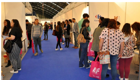
A terceira edición da Finde. U pechouse con máis de 1000 participantes.