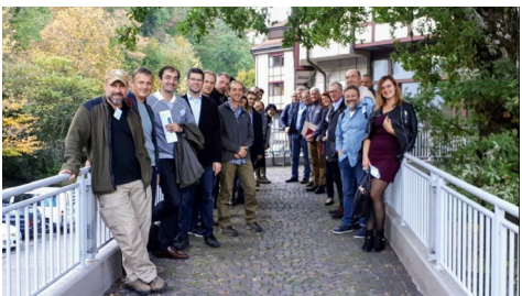
Participantes neste encontro.