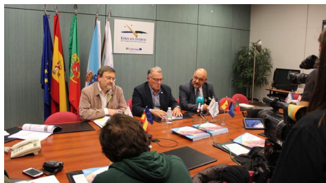
Picos, García e Vázquez Mao.

21 millóns de euros en total, cunha media anual de sete millóns de euros. Esta é a estimación do impacto económico xerado polo Campus de Ourense-Campus da Auga no período 2014/2016 segundo un estudo feito por investigadoras e investigadores da Facultade de Ciencias Empresariais e Turismo. O seu traballo sobre a repercusión económica da institución académica no desenvolvemento da provincia, indican, constitúe o primeiro deste tipo que se realiza no Sistema Universitario de Galicia. +Info.