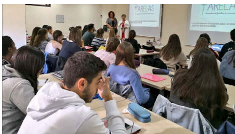
A Escola Universitaria de Enfermaría acolle un seminario sobre identidades sexuais non normativas.