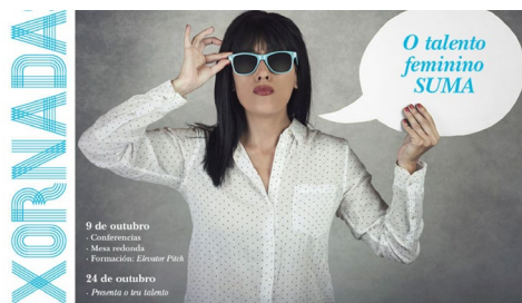
Cartel das xornadas.