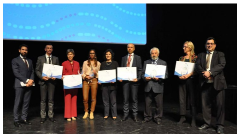
Os galardoados cos Atlantic Project Awards.