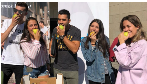
Estudantes do campus de Pontevedra.