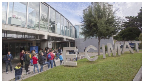
A Ecimat abriu este sábado ao público as súas portas coa realización de múltiples actividades para a cidadanía.

Máis de 400 persoas participaron este sábado nas primeiras actividades de Ciencia Singular , o programa de divulgación científica co que a Universidade busca dar a coñecer á sociedade o traballo levado a cabo nos tres centros singulares de investigación da universidade viguesa: o Centro de Investigación Mariña, CIM; o Centro de Investigacións Biomédicas, Cinbio, e Centro de Investigación en Tecnoloxías de Telecomunicación, atlanTTic. +Info.