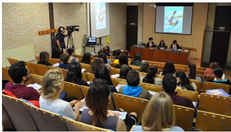
Vista das e dos asistentes ás xornadas.