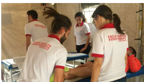
Preto de 50 estudantes participaron nestas unidades nos últimos meses.