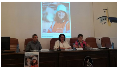
O ciclo de conversas en empresariais, que inclúe relatorios, mesas redondas e proxeccións.