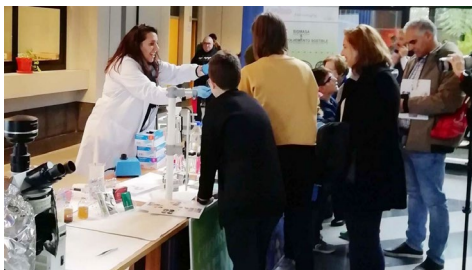
Imaxe da actividade celebrada en Ourense.