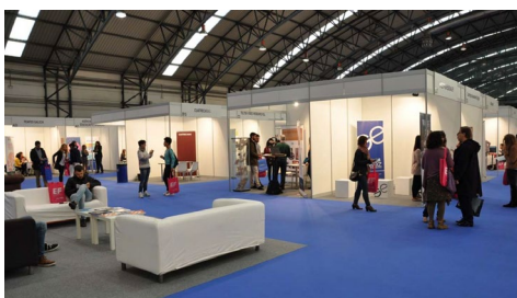
Unha imaxe da segunda edición da feira.