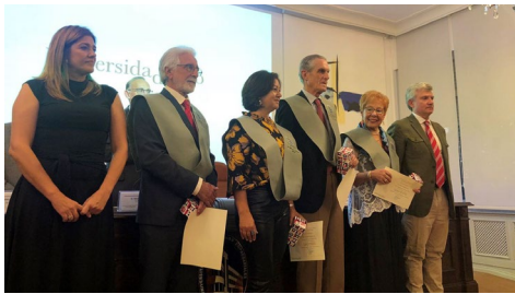
Un intre do acto de graduación celebrado na EU de Estudos Empresariais.