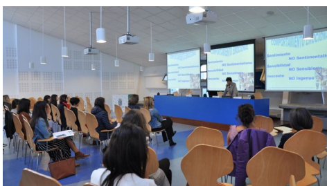
Muller e mundo empresarial unha simbiose posible.