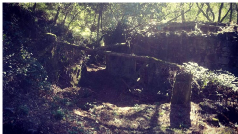
Imaxe do percorrido.