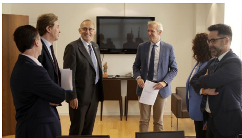
Rueda e Reigosa repasaron e afondaron no proxectos de colaboración que manteñen a administración autonómica e a institución académica.