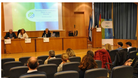
No workshop da rede Bioagua, que aglutina grupos de investigación das tres universidades.

Unha oportunidade para poñer en práctica, con casos reais, os coñecementos adquiridos na súa formación académica é o que supón para o alumnado de Fisioterapia a participación nas unidades de voluntariado coas que a facultade colabora con diferentes actividades e eventos deportivos. Dez alumnos e alumnas da titulación colaboraron este domingo coa IV Carreira Solidaria pola Esclerose Múltiple que a asociación Avempe desenvolveu en Vigo e preto de 50 teñen tomado parte nesta iniciativa nos últimos meses. +Info.