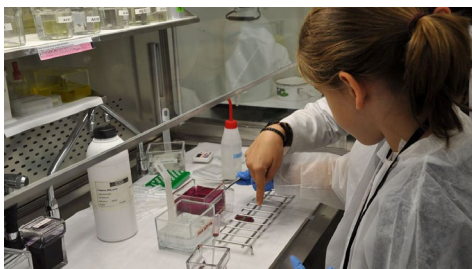
Un intre dos experimentos da xornada Un día no Cinbio.

No marco das actividades do proxecto Green Campus, a Vicerreitoría impulsa o vindeiro luns 22 a oitava edición da Semana de Recollida de RAEE (Residuos de Aparatos Eléctricos e Electrónicos), na que se instalarán nas diferentes facultades e escolas, así como na Casa das Campás, no Pavillón Universitario e na Escola Infantil do campus, puntos de recollida nos que a comunidade universitaria poderá depositar todo tipo de dispositivos que funcionan con electricidade, pilas e baterías, e que, polas súas características contaminantes, precisan dun tratamento específico como residuos. +Info.