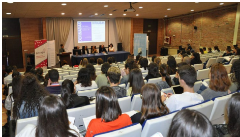
Apertura das xornadas no salón de actos da facultade de Filoloxía e Tradución.