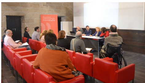
O comité ambiental do proxecto Green Campus aprobou o plan de acción para o presente curso.