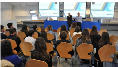
O Máster en Xestión e Desenvolvemento Sostible entregou o 6º prenio Eva Paz.

Múltiples propostas de deporte e saúde dirixidas tanto á comunidade universitaria como ao conxunto da cidadanía integran a oferta de actividades impulsadas para o presente curso pola Área de Benestar, Saúde e Deporte da Universidade no campus pontevedrés. Unha oferta de actividades que nesta xornada foi presentada na sede da Vicerreitoría do campus e composta ademais de polo abono que permite o acceso ás instalacións e servizos do Pavillón Universitario, por actividades dirixidas, rutas culturais, actividades no medio natural e competicións internas, ás que se suman á súa vez os servizos de fisioterapia e medicina deportiva. +Info.