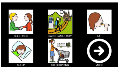
Esta aplicación foi financiada pola Axencia de Turismo da Xunta de Galicia dentro do programa 'O Teu Xacobeo'

Entre as novidades da oferta formativa no campus de Ourense para o vindeiro curso académico está na Facultade de Educación e Traballo Social a posta en marcha do curso Especialista en Autonomía de Mozos e Mozas no Sistema de Protección . A iniciativa pretende facilitar ás e aos profesionais que traballan con mocidade tutelada os coñecementos e habilidades necesarios para que poidan deseñar estratexias socioeducativas eficaces e de calidade para acompañar a este colectivo no seu camiño de emancipación, que xeralmente comeza aos 18 anos. +info .