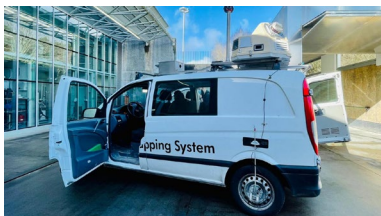
O grupo GeoTECH empregará un sistema de mapeo móbil (Open Lynx Mobile Mapper)

O sector marítimo pesqueiro atópase en pleno proceso de transición cara un modelo moito máis sostible e, para conseguilo, debe transformarse nunha actividade máis sustentable, tanto desde o punto de vista medioambiental, como social –dereitos laborais- e, incluso, económico. Esta é a idea central sobre a que se está a debater este xoves e venres no Seminario internacional Os desafíos da pesca sostible, unha actividade organizada no marco do proxecto Jean Monnet Une vision européenne des océans et des mers: pêche maritime et croissance durable , que, tras dous anos de intenso traballo, está a piques de finalizar. +info .