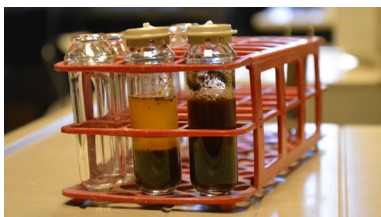
Traballo no laboratorio no marco do proxecto

O ‘boom’ dos parques eólicos en Galicia está a xerar múltiples inquedanzas entre as comunidades afectadas por estes proxectos, preocupades polos efectos sociais, económicos e ambientais destas explotacións. Para achegar un pouco de luz a esta situación, o Observatorio Eólico de Galicia, OEGA, entidade adscrita á Universidade de Vigo que conta co apoio das fundacións Juana de Vega e Isla Couto, programou para este mes de xullo unhas xornadas divulgativas con expertos do mundo do Dereito. +info .