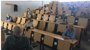
Un actividade do Programa para Maiores celebrada este curso no campus de Ourense