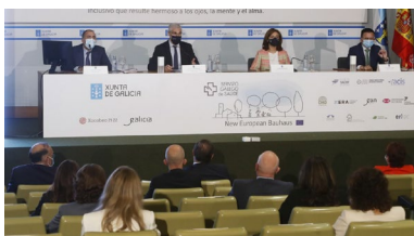
Participantes no acto de sinatura deste convenio.

Teletraballo, videoconferencias, compras en liña, banca dixital, ocio virtual... A dixitalización é un dos principais retos aos que ten que enfrontarse a sociedade galega, un desafío que xa estaba presente e que a pandemia da covid-19 puxo máis que nunca no centro do debate. Conscientes desta realidade o Consello Económico e Social de Galicia acaba de encargarlle á Universidade de Vigo a realización dunha diagnose rigorosa sobre todo este proceso. +info.