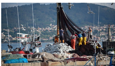
O proxecto conta cun orzamento de máis de 50.000 euros

Buscaban unha solución tecnolóxica capaz de mellorar a accesibilidade do Camiño de Santiago e o resultado é PictoXacobeo , unha aplicación para Android deseñada especificamente para facilitar a interacción dos peregrinos do Camiño de Santiago con necesidades comunicativas especiais (trastornos da fala, comprensión lectora e escritora, dificultades da linguaxe, etc.). +info .