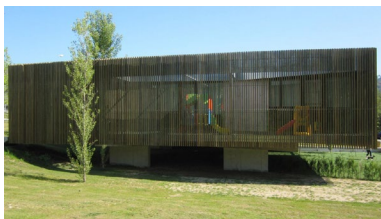
Imaxe do centro.