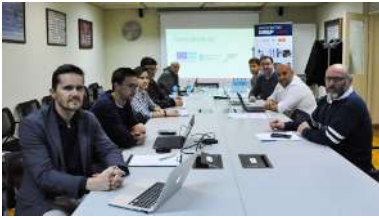
Participantes na reunión de peche do proxecto Sirep.