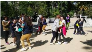
Imaxe dunha edición anterior.

Divididos en diferentes equipos, estudantes de diferentes titulacións e países traballarán conxuntamente durante dez semanas no desenvolvemento de proxectos interdisciplinares dirixidos a promover melloras para a comunidade. Este é o obxectivo central das estadias que neste mes de marzo se poñen en marcha en Brasil e Uruguai ao abeiro do proxecto europeo Lapassion ( Latin America Practices and Soft Skills for an Innovation Oriented Network ), unha iniciativa financiada polo programa comunitario Erasmus+ na que participan 15 institucións europeas e latinoamericanas, entre as que figura, a través do Campus Crea, a Universidade de Vigo. +info.