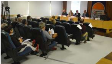
A facultade de Ciencias Sociais e da Comunicación acolle o III Congreso de Estudos Internacionais da Galicia..