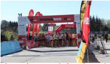
Por mor da convocatoria electoral, a carreira adiantase un día.