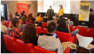
Doce especialistas de diferentes países participan nun simposio na Vicerreitoría do Campus.