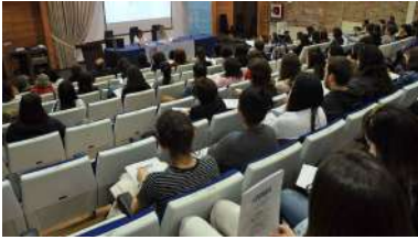
A FFT acolleu a xornada da prevención e sensibilización sobre violencia sexual na mocidade.