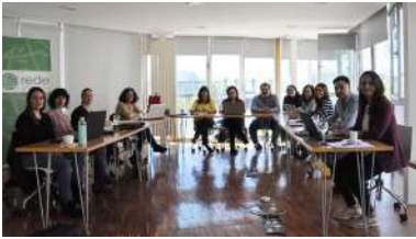
Un intre da xuntanza celebrada na Facultade de Ciencias Económicas e Empresariais.