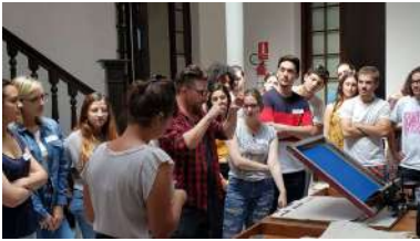
Participantes de Lapassion en Montevideo.