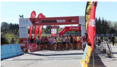
Por mor da convocatoria electoral, a carreira adiantase un día.

A coincidencia de data de celebración das eleccións xerais do 28 de abril coa carreira HappyGoRunning-Cidade Universitaria supuxo un reto para o Servizo de Benestar, Saúde e Deporte da Universidade de Vigo. A mes e medio da cita, a organización viuse obrigada a suspender temporalmente as inscricións ata acordar unha nova data. Finalmente, a carreira universitaria, inserida no Circuito RunRun Vigo de Carreiras Populares, celebrarase un día antes do previsto, o sábado 27 en horario de tarde. +info.