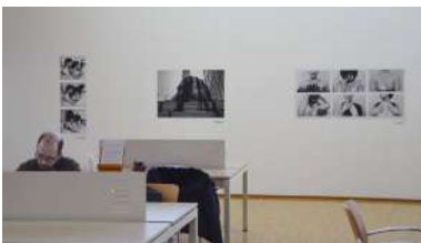
A mostra ocupa diversos espazos do centro.

O día 11 de abril celebrarase en diversos espazos da cidade e do campus de Ourense as XVI Xornadas Interxeracionais . Arredor de 150 persoas con idades e capacidades diversas daranse cita nunha actividade que pretende, a través do xogo, rachar as barreiras que socialmente separan ás persoas segundo a súa idade ou capacidades. Na organización da actividade traballan desde principios deste curso académico 70 alumnas e alumnos de primeiro e segundo curso do Grao en Educación Social da Facultade de Ciencias da Educación, co apoio do centro, da Vicerreitoría do Campus de Ourense e de Ategal, a Asociación Cultural Galega de Formación Permanente de Adultos. +info.