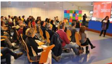
Um 8M tinguido de vermello e lila.

A fenda de xénero nas titulacións universitarias é unha das caras máis visibles da desigualdade, con escasa presenza de mulleres nas titulacións técnicas e graos relacionados coa saúde e os coidados totalmente feminizados. A Escola de Enxeñaría de Minas e Enerxía da Universidade de Vigo trata de rachar cos estereotipos asociados coas enxeñarías en diferentes actividades e propostas, unha delas é concurso de fotografía MULLE.Rme para dar visibilidade ao sexo feminino nas profesións técnicas como as relacionadas coa enxeñaría de minas e enerxía. +info.