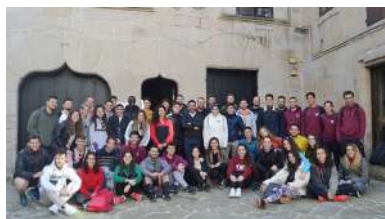
Foto de familia dos e das participantes na asamblea, xunto co vicerreitor do campus.