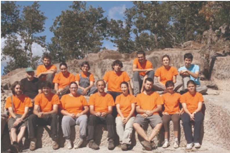
Figura 9. Parte do equipo da campaña de 2012.

Durante o ano 2013 estudáronse todos os restos e as informacións recuperadas durante as campañas de 2011 e 2012, o que deu lugar ás primeiras participacións