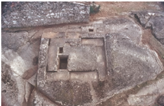
Figura 2. Santuario de Panoias (Vila Real) 4 .