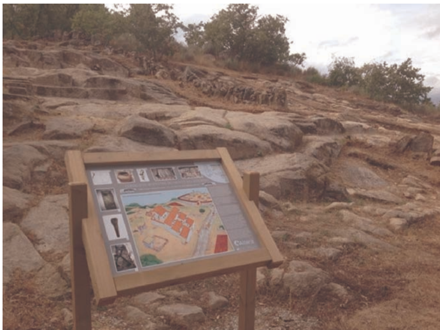
Figura 10. Estado actual do xacemento.