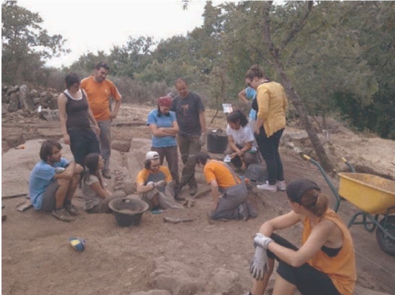
Figura 8. Parte do equipo da campaña de 2011.