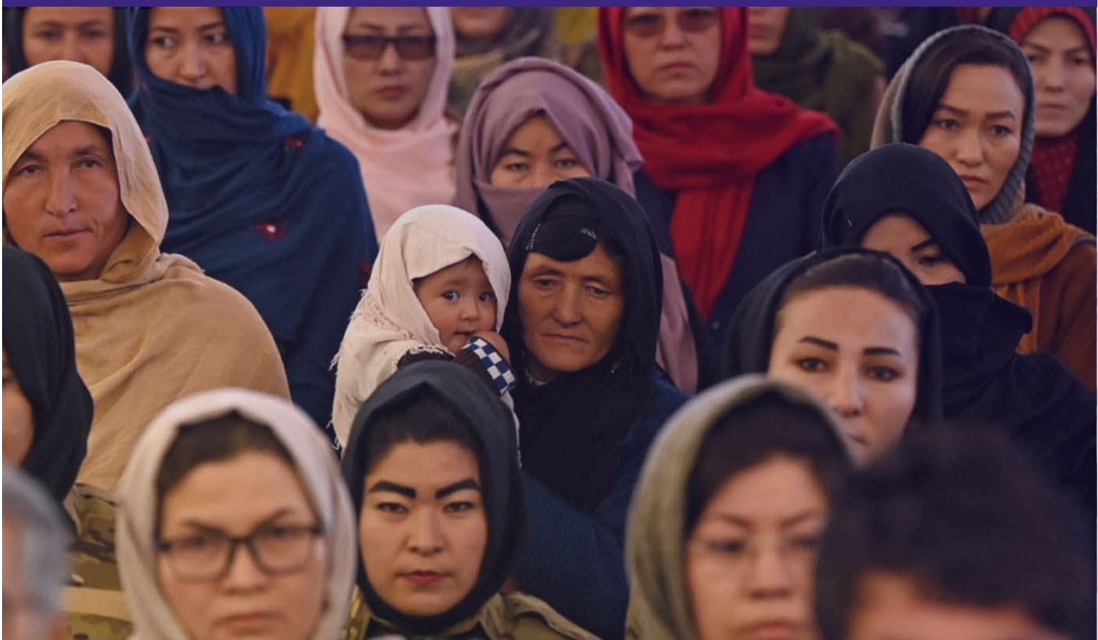
Acto do Día Internacional das Mulleres na provincia de Bamiyán (Afganistán (2021)

Publicación mensual da Unidade de Igualdade