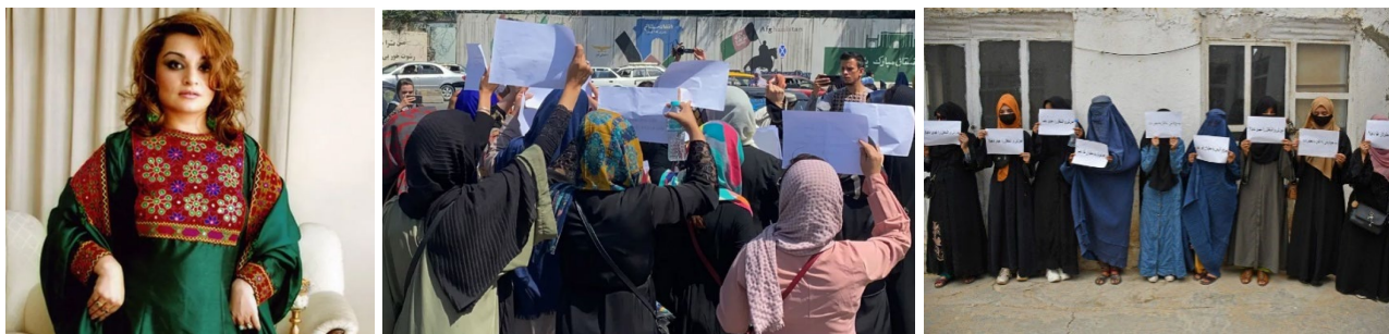
A impulsora da campaña en redes contra o código de vestimenta #DoNotTouchMyClothes que levaron a cabo afgás que viven no estranxeiro e mulleres protestando polos seus dereitos en Kabul en setembro de 2021 e en Mazar-i-Sharif en xuño de 2023

Tras a violenta represión das protestas na rúa nos primeiros meses tras a chegada do novo réxime, as mulleres idearon unha nova estratexia para protestar dentro das casas e gravarse para difundilo e que poidan ser vistas e escoitadas e se coñezan as súas reivindicacións e a súa resistencia.