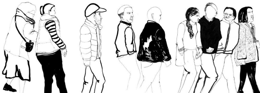
Obra do traballo Pasea y ojea de Clara Nubiola

Nos últimos anos son moitas as iniciativas para crear roteiros en feminino onde se ofrece unha visión máis completa das cidades que habitamos, poñendo o foco no papel das mulleres e reivindicando que os seus nomes sexan visibles, nomeando rúas, prazas e espazos públicos. A cidade de Vigo conta, desde o ano 2011, co Roteiro en feminino Sons de Mulleres , creado polo colectivo Mulheres Nacionalistas Galegas, e que foi sinalizado co apoio da Concellería de Igualdade. En Ourense, a Marcha Mundial das Mulleres tamén organizou o Roteiro en Feminino , un percorrido con once paradas no que se falaba de Concepción Arenal, Jesusa Prado López, Milagros Cid Fernández, «A Milo», Sally Albaugh, María Paz del Valle e Antonia Ortiz Currais, entre outras. No caso de Pontevedra, no proxecto do Gris ao Violeta destacan o Roteiro Mulleres en San Amaro ou o Roteiro sobre as mulleres represaliadas de Pontevedra , que se pode seguir coas indicacións dispoñibles na súa web. Este tipo de propostas tamén se levaron e se levan a cabo noutras cidades e vilas galegas como Ferrol , Viveiro ou Santiago de Compostela .