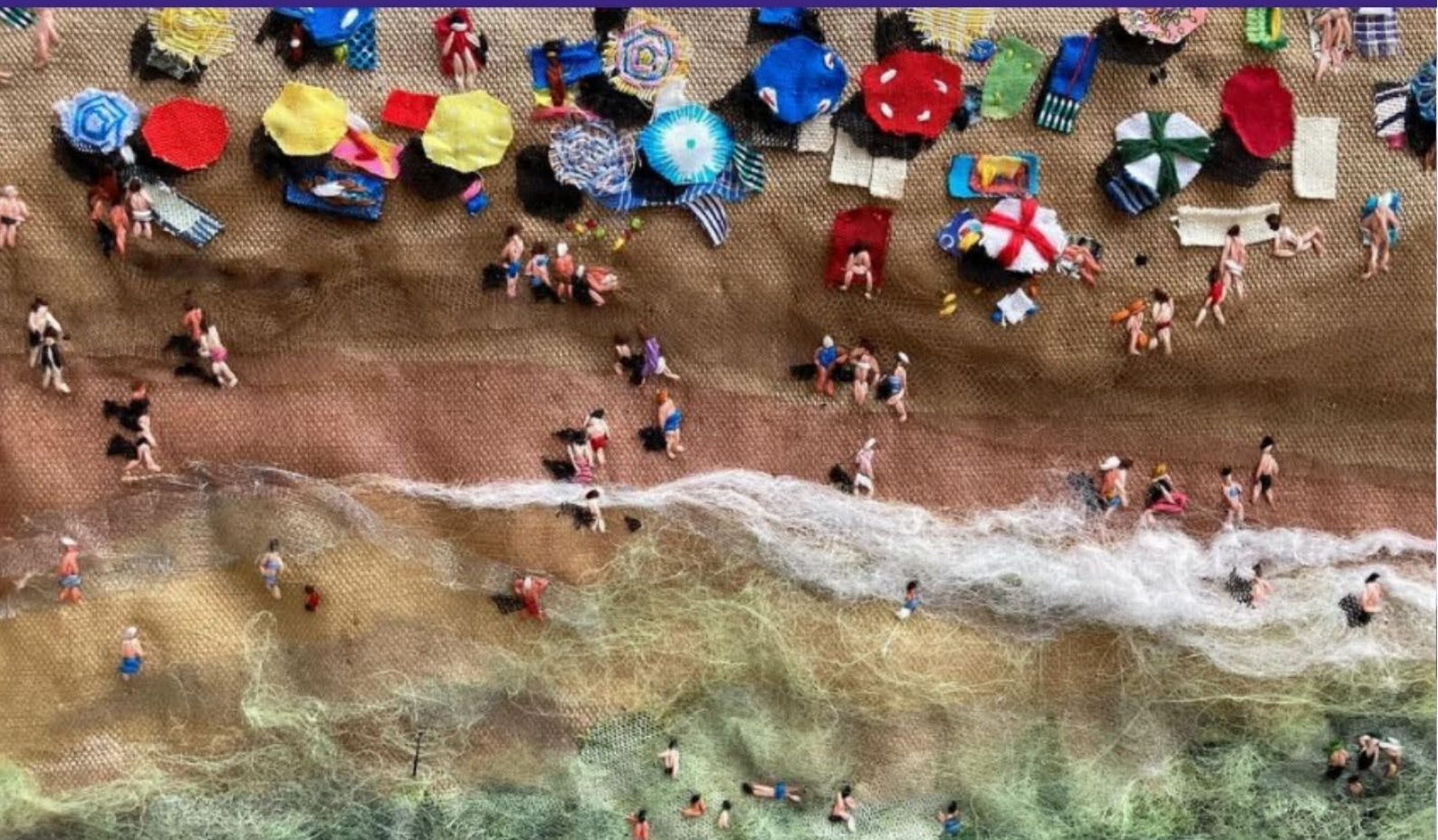
Obra textil da artista Sandrine Torredemer «La filature» (Perpiñán, 2024)

Publicación mensual da Unidade de Igualdade