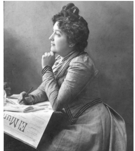
Carmen de Burgos

Tamén destacamos a Carmen de Burgos (1867-1942), xornalista, tradutora e autora feminista. Foi a primeira muller reporteira profesional de España, así como a primeira corresponsal de guerra. Escribiu varios libros de viaxe recollendo cartas, impresións e conferencias, aínda que o principal é Mis viajes por Europa , onde describe o seu traxecto desde Madrid ata o punto máis setentrional de Europa: o cabo Norte, en Noruega. Na serie de RTVE Mujeres viajeras recompílanse as biografías de outras mulleres que se desprazaron ao redor do mundo.