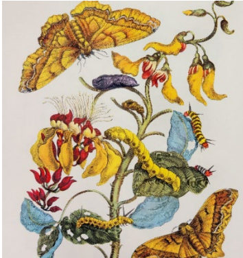
Ilustración de Maria Sibylla Merian

Outra galega que realizou unha longa travesía foi Isabel Zendal , enfermeira e reitora do Hospital da Caridade da Coruña. No ano 1803 participou na Real Expedición Filantrópica da Vacina para espallar a cura da varíola, converténdose na primeira enfermeira en misión internacional. Ademais das súas funcións como sanitaria, polas que cobraba o mesmo que os homes da expedición, Isabel encargouse dos coidados das crianzas a bordo do barco.