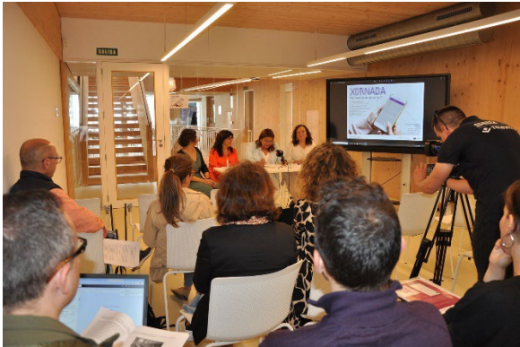
Presentación de MAX APP en Redeiras