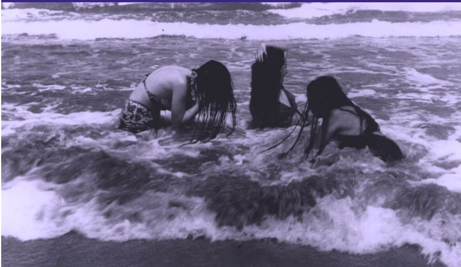
Chachalacas, fotografía de Lola Álvarez Bravo (Veracruz, México, 1945)

Publicación mensual da Unidade de Igualdade