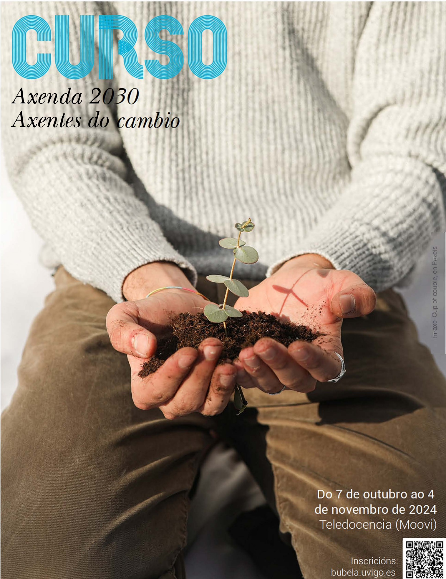
linaxe - Cup of couple, en Pixeis

Do 7 de outubro ao 4 de novembro de 2024 Teledocencia (Moovi)