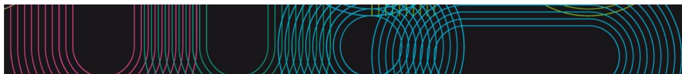
TABLA DE ERROS